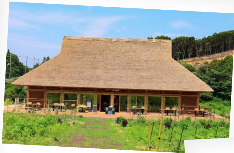
陽・燦燦 / 淡路島