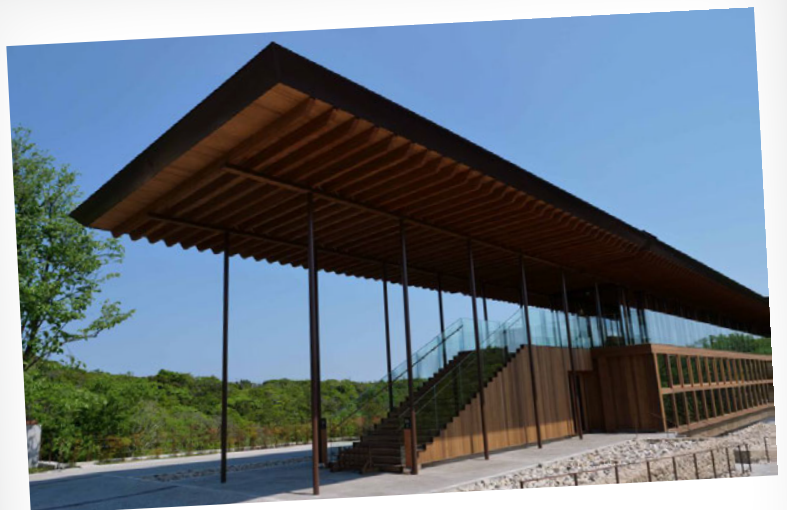
禅坊 靖寧 / 淡路島