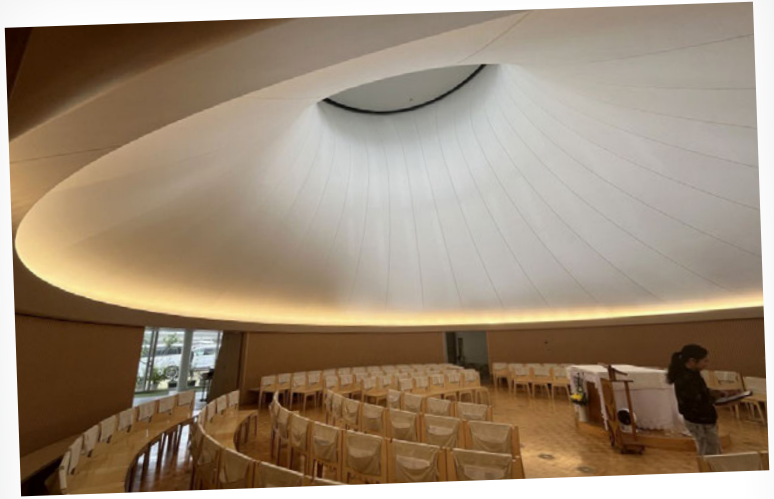
カトリックたかとり教会 / 神戸