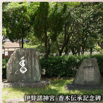
伊弉諾神宮 香木伝承記念碑